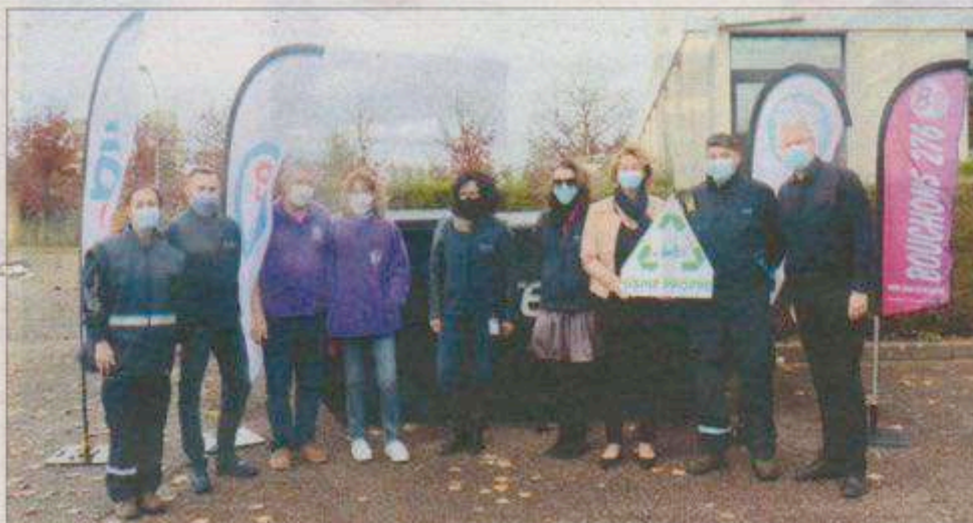
Des représentants du SamClub, d'Ortec, Bouchons 276, ExxonMobil et son groupe environnement devant la benne installée près de la cafétéria